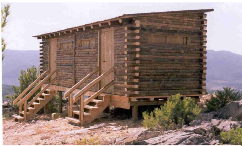
Foto nº3: Vista posterior del observatori. Els accessos a la part darrera permeten l'entrada i l'eixida fora de les mirades dels voltors del canyet i dels voltants.