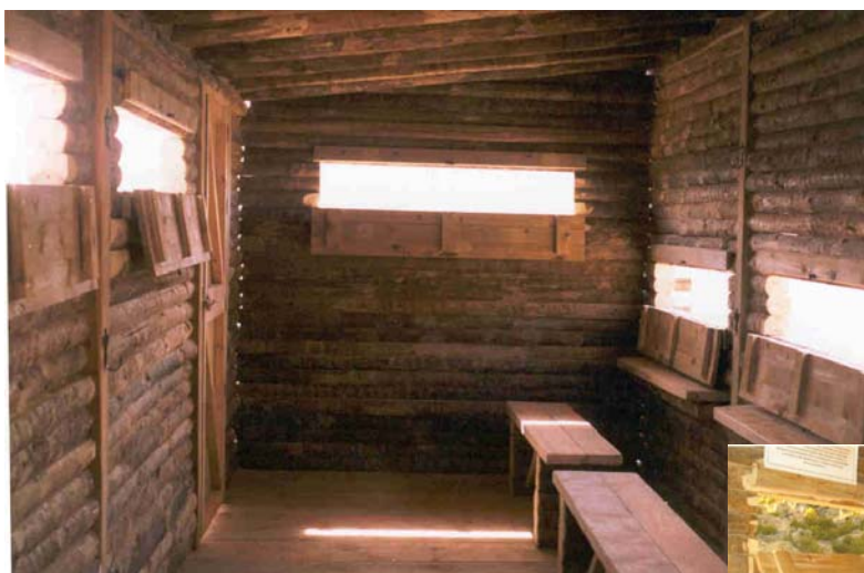
Foto nº4: Al seu interior l'observatori està provist de bancs, tauletes i perxes.