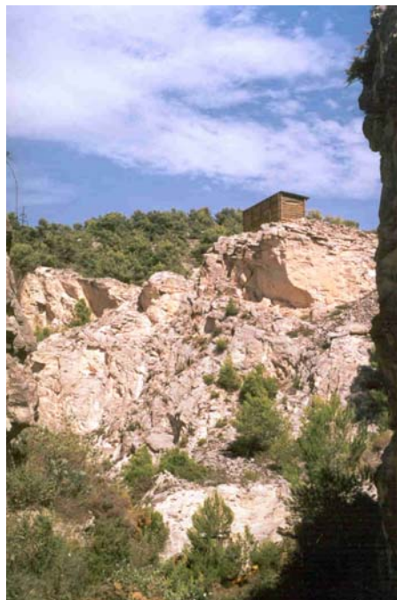
Foto nº2: Amb l'utilització de materials rústics com la fusta tractada, s'aconsegueix integrar plenament l'observatori en l'entorn.